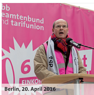
Berlin, 20. April 2016