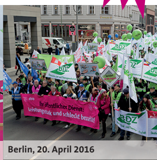
Berlin, 20. April 2016