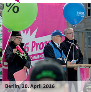
Berlin, 20. April 2016