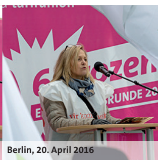
Berlin, 20. April 2016